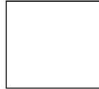
Huella indice izquierdo